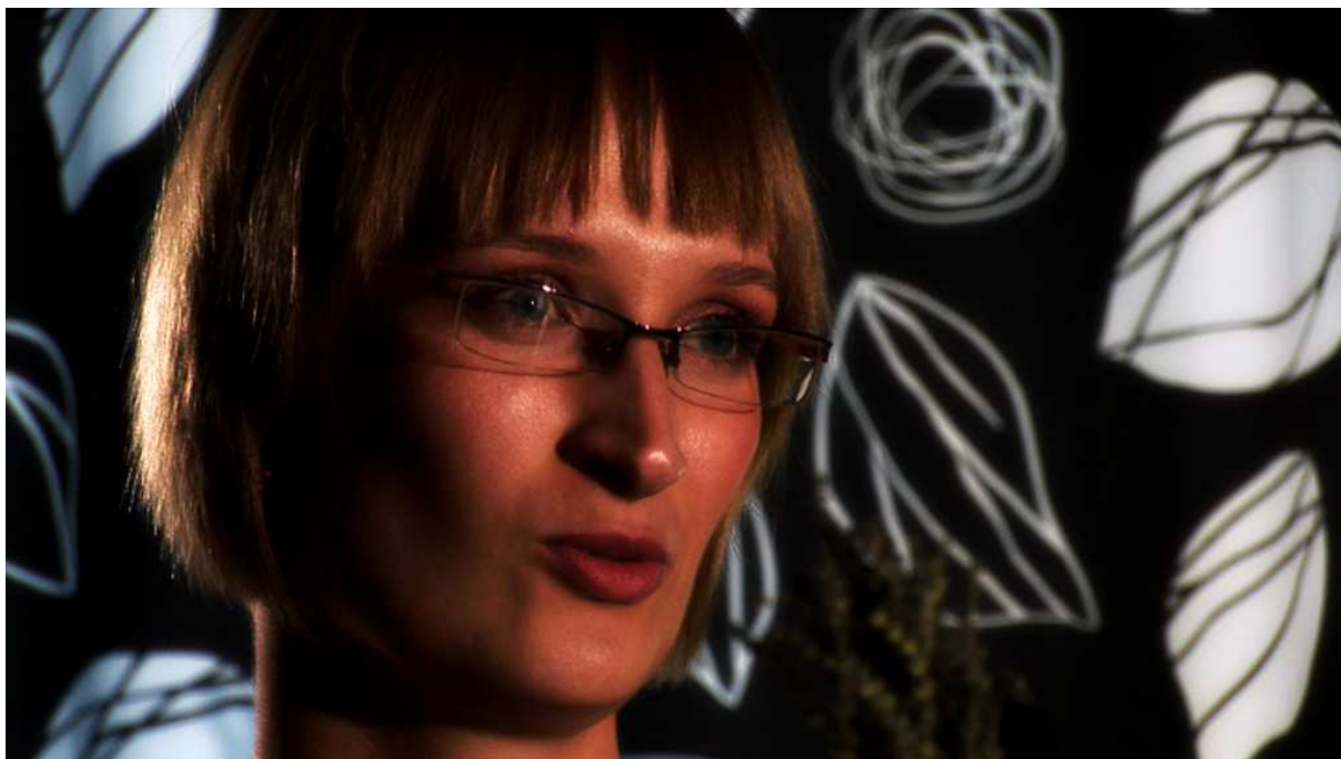
CÓRKA ALEKSANDRA, FOTOS Z FILMU „OKRUCHY ROZBITEGO DZBANA” 2011

Po 13.12.1981 roku uruchomił jedną z pierwszych podziemnych drukarni i współorganizował strukturę poligraficzną „Solidarność” Dolny Śląsk. Od 1982 roku w Solidarności Walczącej. W 1982 roku współzałożyciel Niezależnej Agencji Fotograficznej Dementi.