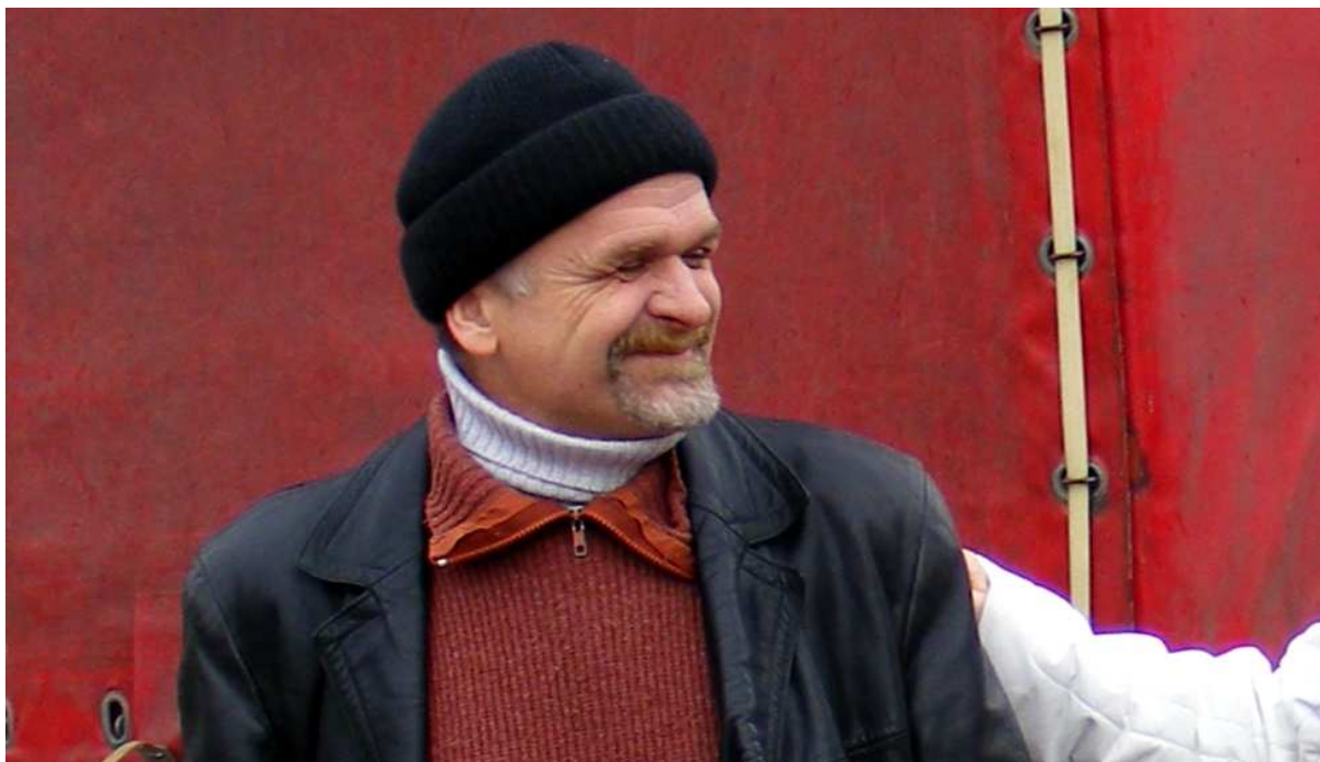
KRZYSZTOF GULBINOWICZ W 2009 ROKU, FOTOS Z FILMU „OKRUCHY ROZBITEGO DZBANA” 2011

Autorzy filmu wykorzystali wszelkie dostępne archiwalia – zarówno filmowe, jak i fotografie i dokumenty ze zbiorów prywatnych osób, które znały Krzysztofa Gulbinowicza, oraz z Instytutu Pamięci Narodowej, Archiwum Solidarności Walczącej i innych nieznanymi dotąd źródeł. Twórcy o filmie: „Mamy nadzieję, że powstał ciekawy film dokumentalny, biograficzny, pokazujący, jak determinacja jednego człowieka, przepelnionego miłością do wolności, potrafiła przełamać wszelkie bariery i pokonała wszelkie przeciwności losu.”